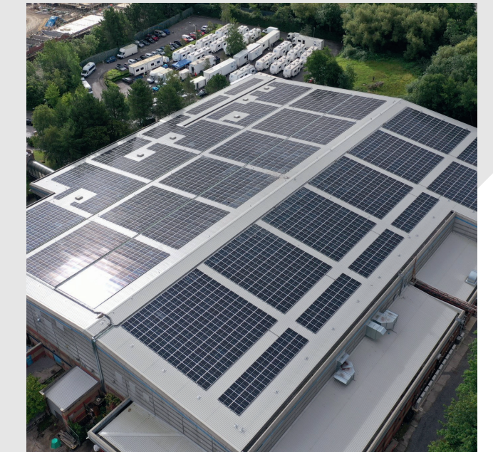
Solar-powered studio space at TBY2.

Dim ond 14% o gynyrchiadau sy'n cael eu ffilmio mewn stiwdios yn y DU sy'n defnyddio ynni adnewyddadwy