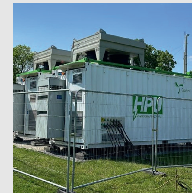
Hydrogen generators used on BBC SpringWatch.